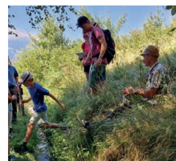
Die Hührung entlang der Suone Niwärch.