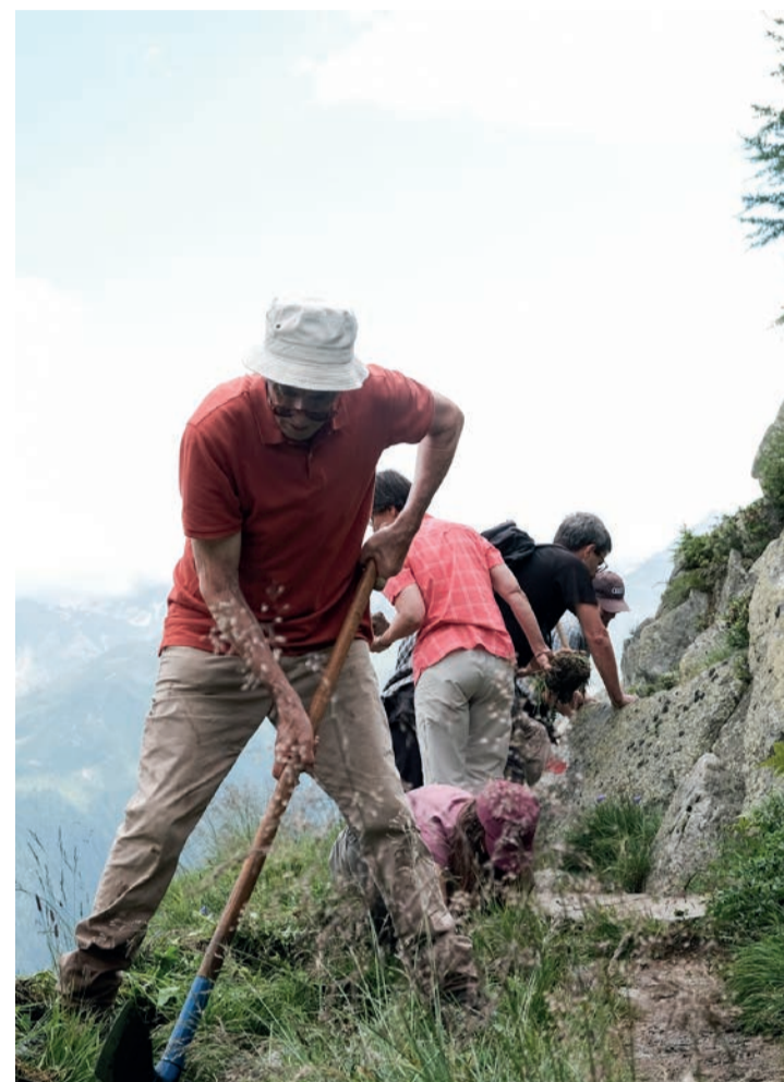
Die Erbauer von Suonen achten vor allem darauf, dass die Suone mit möglichst wenig Gefälle fliesst.