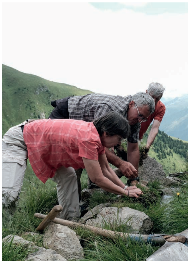
Es wird dafür gesorgt, dass das Wasser die Suone ungehindert durchfliessen kann und kein Wasser verloren geht.

Die Stiftung Altes Bellwald und der Verein BellwaldPlus organisieren einen Kurs. Nach dessen Abschluss können Kontrollgänge entlang der Suone Unnera eigenständig durchgeführt werden.