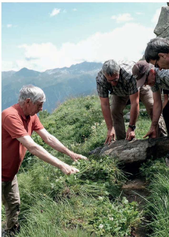
Die neu abgedichtete Talseite des Treschbords wird mit einem grossen Stein belastet, um eine bessere Verdichtung zu erreichen.